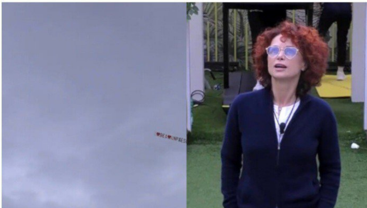
L'aereo per Beatrice